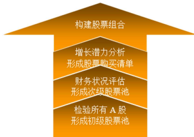
图：本基金选股流程

本基金基金经理将对股票购买清单上的股票进行逐一分析和比较，挑选出其中股价下跌风险最低且上涨空间最大的股票构建具体的股票组合。